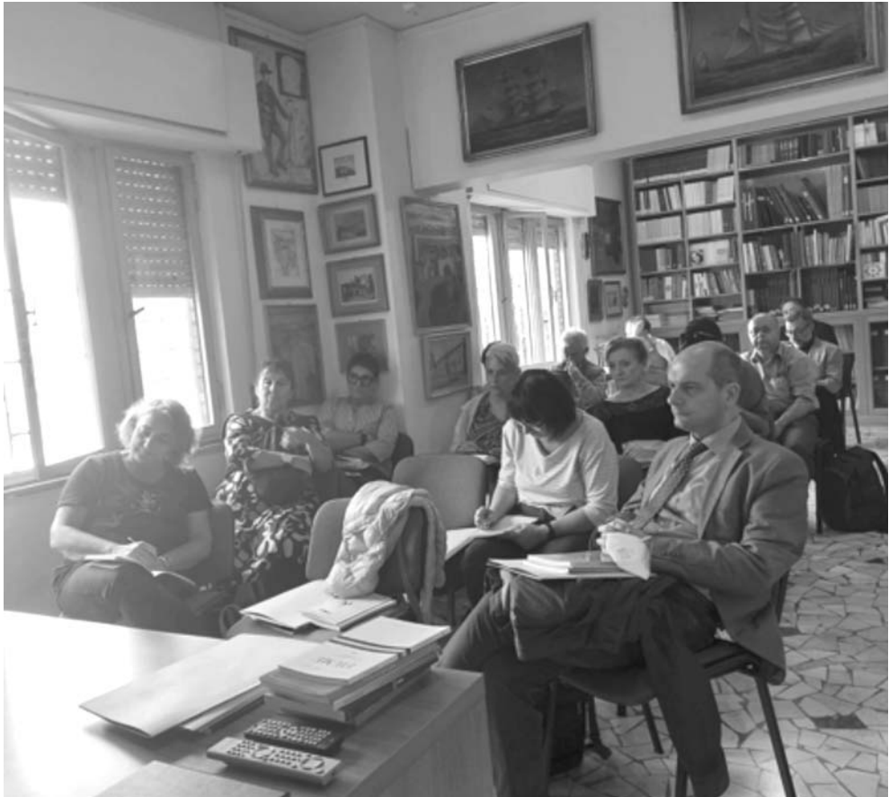
Roma, 22 ottobre 2022: docenti dalla Toscana nei locali dell'Archivio Museo storico di Fiume